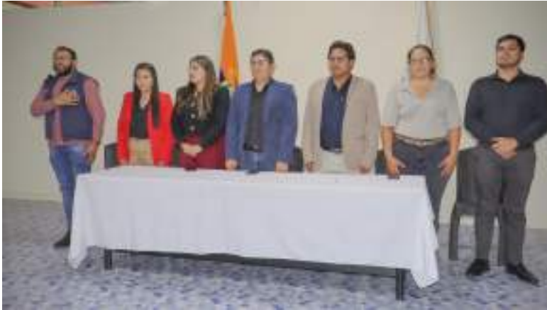
Elección y posesión del nuevo Órgano Colegiado Superior