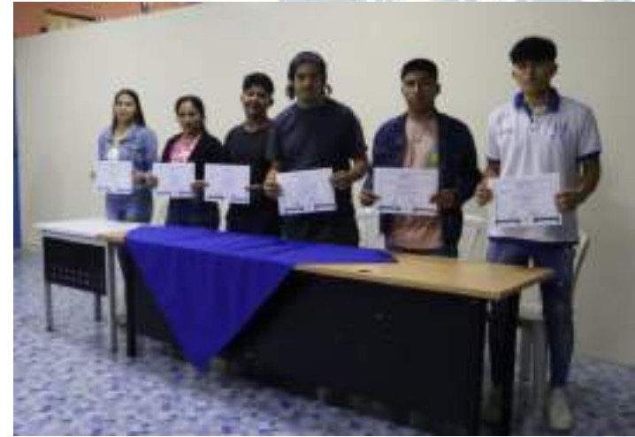
Elección y posesión del Consejo Estudiantil