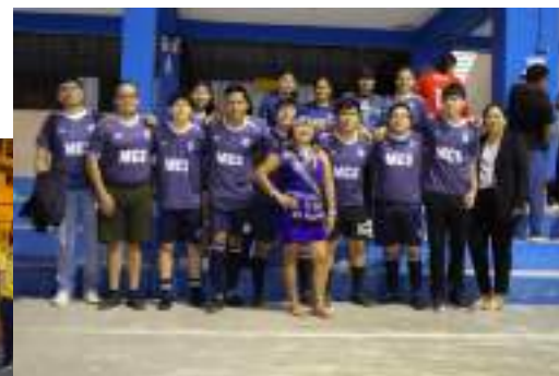
Desarrollo de las jornadas deportivas internas