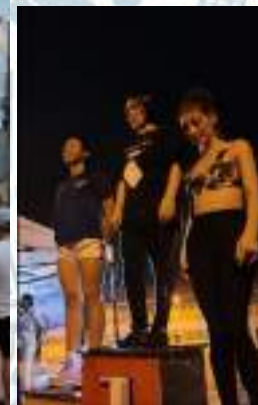
Carrera Nocturna IST Limón 3k